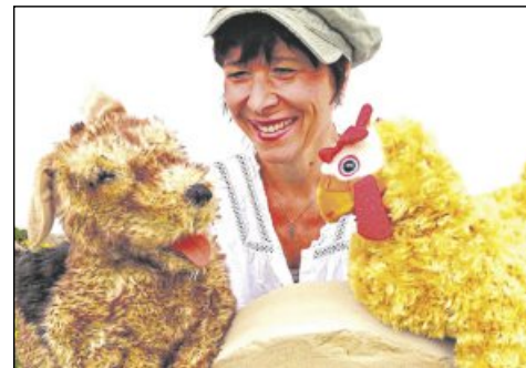
Kinderprogramm beim Jazzclub Armer Konrad: Das Liedertheater Altmann führt das Stück „Die Wunder-Mühle“ auf.

Die beiden Müllergesellen Gretl und Fritz wollen wieder hinaus einmal in die Welt. Klar! Das Wandern ist des Müllers Lust! Bald schon kommen sie an einer seltsamen und geheimnisvollen Mühle vorbei. Obwohl diese Mühle an einem Bach liegt, hat sie nicht nur ein Wasserrad, sondern auch Windmühlflügel. Und sie ist offenbar verlassen – oder etwa doch nicht? Da fassen sich Gretl und Fritz ein Herz und treten ein. Und wie sich alsbald herausstellt, mahlt diese Wundermühle etwas ganz Besonderes! Nämlich nichts weniger, als das Glück der Welt. Aber das ist schon fast ausgegangen. Und niemand kennt das Rezept. Mehr wird an dieser Stelle nicht verraten. Auf alle Fälle gibt es für die Zuschauer bei diesem Stück, das 2019 im Stiftskeller Premiere feierte und seitdem leider nur selten aufgeführt werden konnte, jede Menge Dinge zum Staunen, Lachen und natürlich auch zum Mitsingen und Mitmachen. 2022 wurde das Projekt wiederaufgenommen und neu inszeniert. Das Projekt wurde