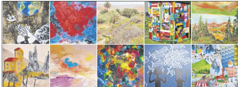
Bilder aus der aktuellen Online-Ausstellung des Kunstraums